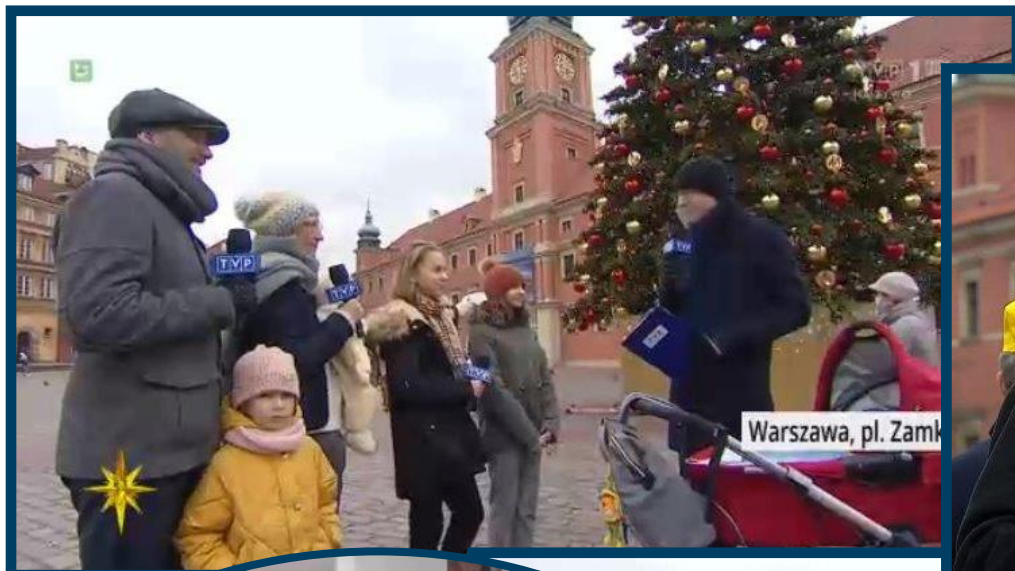
Warszawa, pl. Zamk