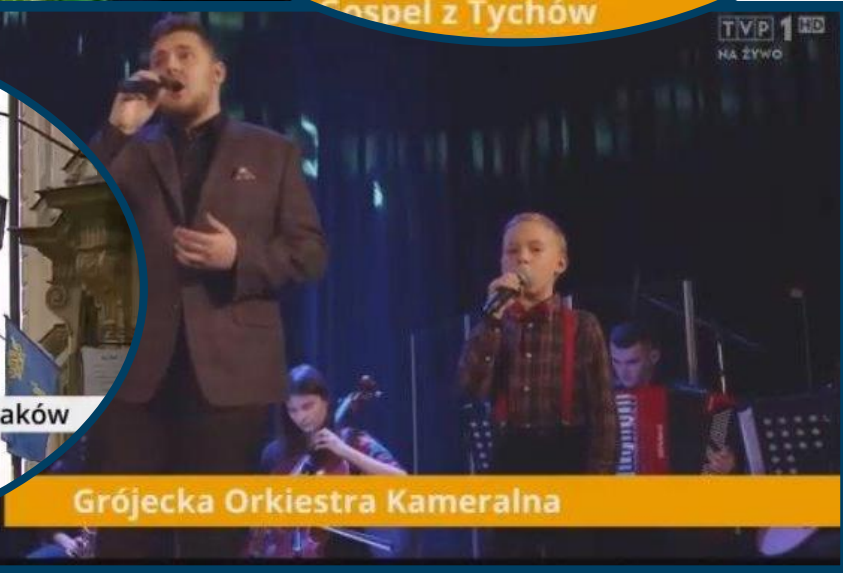
Grójecka Orkiestra Kameralna