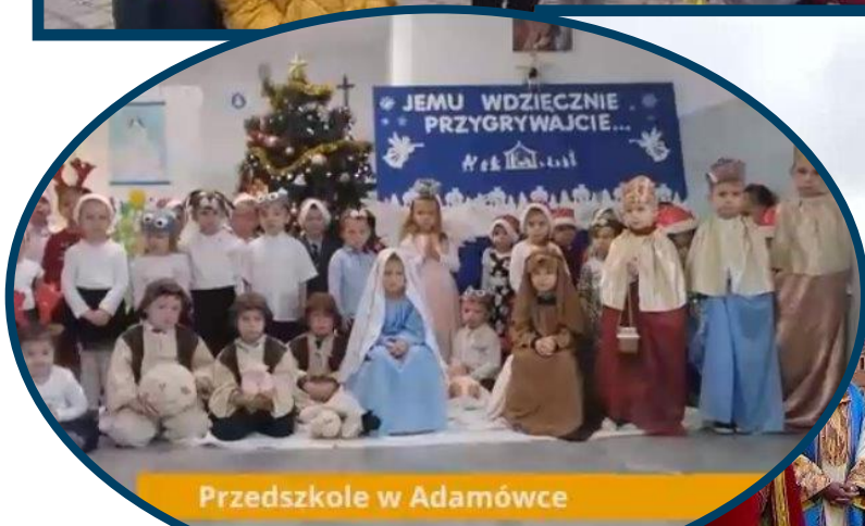
Przedszkole w Adamówce