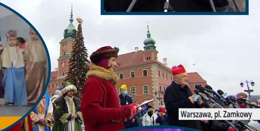
Warszawa, pl. Zamkowy