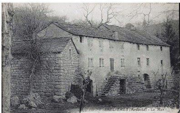
Dom rodzinny św. Teresy