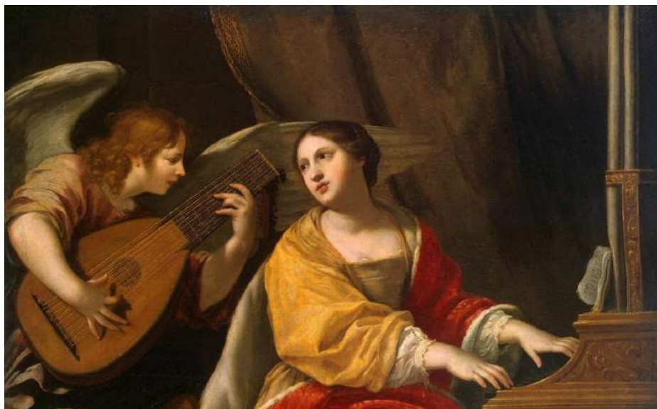
St Cecilia by JACQUES BLANCHARD

Do namiestnika Almachiusza dotarła informacja, że Cecylia jest chrześcijanką i cały majątek swój i narzeczonego rozdała potrzebującym. Namiestnik nakazał ją aresztować. Według legendy żołnierze ujęci jej urodą i młodością prosili ją, by wyrzekła się wiary w Chrystusa. Cecylia odpowiedziała im: „Nie lękajcie się spełnić nakazu, bowiem moją młodość doczesną zamienicie na wieczną młodość u mego oblubieńca, Chrystusa”. Jej słowa miały nawrócić 400 żołnierzy. Została skazana na męki – wisiała nad ogniem