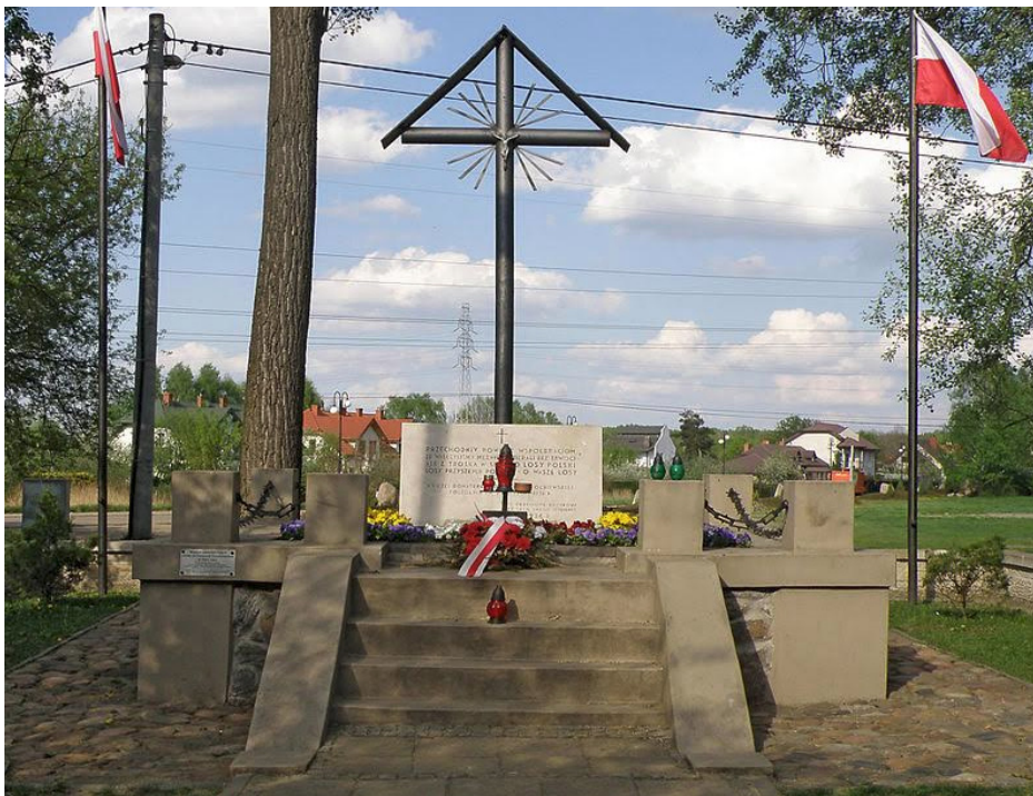
Kurhan poległych pod Olszynka Grochowska

JEDYNE POLSKIE POWSTANIE OGÓLNOKRAJOWE, KTÓRE MIAŁO SZANSE. JEDYNE, W KTÓRYM PAŃSTWO POLSKIE TOCZYŁO WOJNĘ Z ZABORCĄ-OKUPANTEM JAK RÓWNY Z RÓWNYM. JEDYNE, KTÓRE - CHOĆ ZACZEŁO SIĘ OD ZBROJNEGO SPISKU - PRZEZ PIERWSZE DWA MIESIĄCE POLEGAŁO PO PROSTU NA FUNKCJONOWANIU NIEPODLEGŁEGO PAŃSTWA: DZIAŁAŁ RZĄD, PARLAMENT, ISTNIAŁA POLSKA ARMIA.