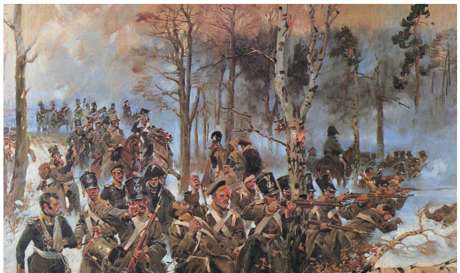
Bitwa pod Olszynką Grochowską (Wojciech Kossak)

zakazem pobytu w Warszawie. Jego pogrzeb w Warce w 1875 r. był wielką manifestacją narodową.