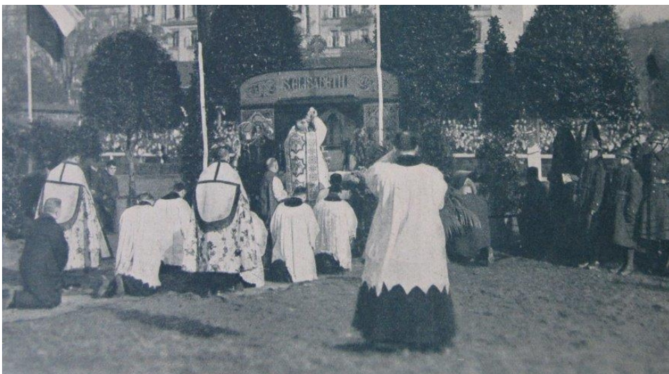
Dziesięciolecie Święta Niepodległości 11. 11.1928 r.