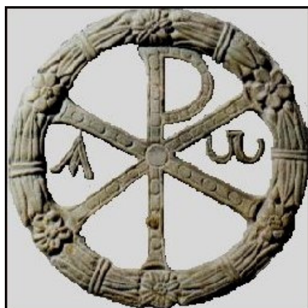
Chrystogram Chi-Rho, jeden z najstarszych używanych przez chrześcijan

Z a najstarsze modlitwy za zmarłych uznać można inskrypcje nagrobne, z których najwcześniejsze można datować na rok 71. Wiele z nich to bardzo proste wezwania (PAX, IN PACE) i można je uznać bardziej za stwierdzenia faktu, a nie modlitwy. Można znaleźć jednak bardzo stare inskrypcje, w których wyrażane jest pewne życzenie w imieniu zmarłego. O co proszono? Najczęściej o pokój, dobro (tzn. wieczne zbawienie), światło, odpoczynek, życie, życie wieczne, złączenie z Bogiem lub Chrystusem, złączenie z aniołami i świętymi np. PAX (TIBI, VOBIS, SPIRITUI TUO, IN ÆTERNUM, TIBI CUM ANGELIS, CUM SANCTIS); SPIRITUS TUUS IN BONO (SIT, VIVAT, QUIESCAT); ÆTERNA LUX TIBI; IN REFREGERIO ESTO; SPIRITUM IN REFRIGERIUM SUSCIPIAT DOMINUS; DEUS TIBI REFRIGERET; VIVAS, VIVATIS (IN DEO, IN [Chi Rho], IN SPIRITO SANCTO, IN PACE, IN ÆTERNO, INTER SANCTOS, CUM MARTYRIBUS)